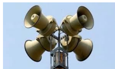
Сигнал «ВНИМАНИЕ ВСЕМ!»

Завывание сирен в населенных пунктах, а также прерывистые гудки на предприятиях означают сигнал: «Внимание всем!».